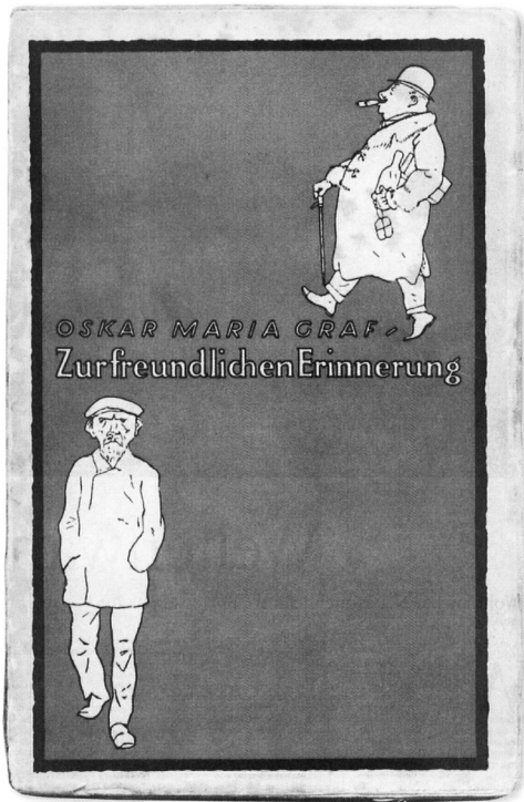
Blickfänge: In der Weimarer Republik entwickelten Buchumschläge noch reichlich Segwirkung

Die Literarische Welt Nr. 32 /2005, Seite 4 wer